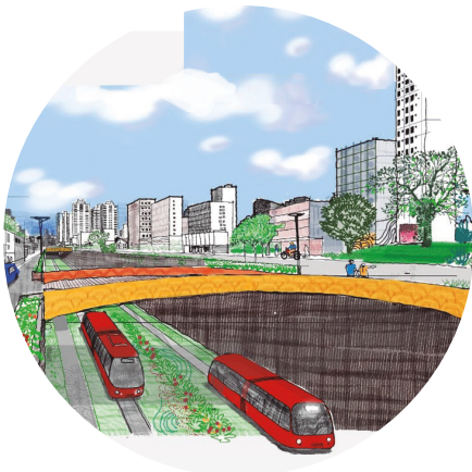
PLANO REGIONAL Metrópole Norte - PR

A URBTEC™ Planejamento, Engenharia e Consultoria é uma empresa brasileira com experiência nas áreas de projetos, planejamento urbano e tecnologia da informação.