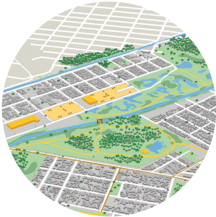
PLANO DIRETOR Piraquara - PR